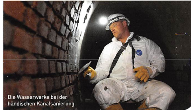
Die Wasserwerke bei der händischen Kanalsanierung

Wir sichern die Trinkwasserversorgung und Abwasserentsorgung sowie die Strom- und Gasversorgung: